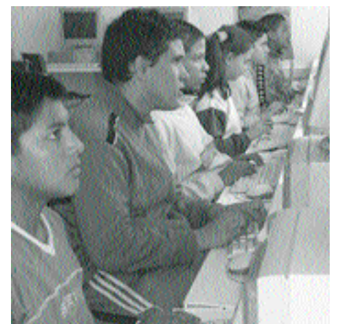
La entrada en el giro digital y la sociedad del conocimiento