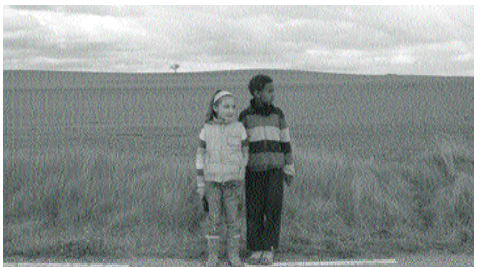
El cambio hacia la cultura de la sostenibilidad

El CEINCE trabaja, en primer lugar, como un observatorio que analiza e interpreta los desafíos que emergen en la sociedad actual y que, con toda probabilidad, prolongarán su impacto en la del futuro. Analiza y usa inteligentemente los recursos de la memoria, pero su atención está siempre fijada en el horizonte que configuran los temas educativos de nuestro tiempo: