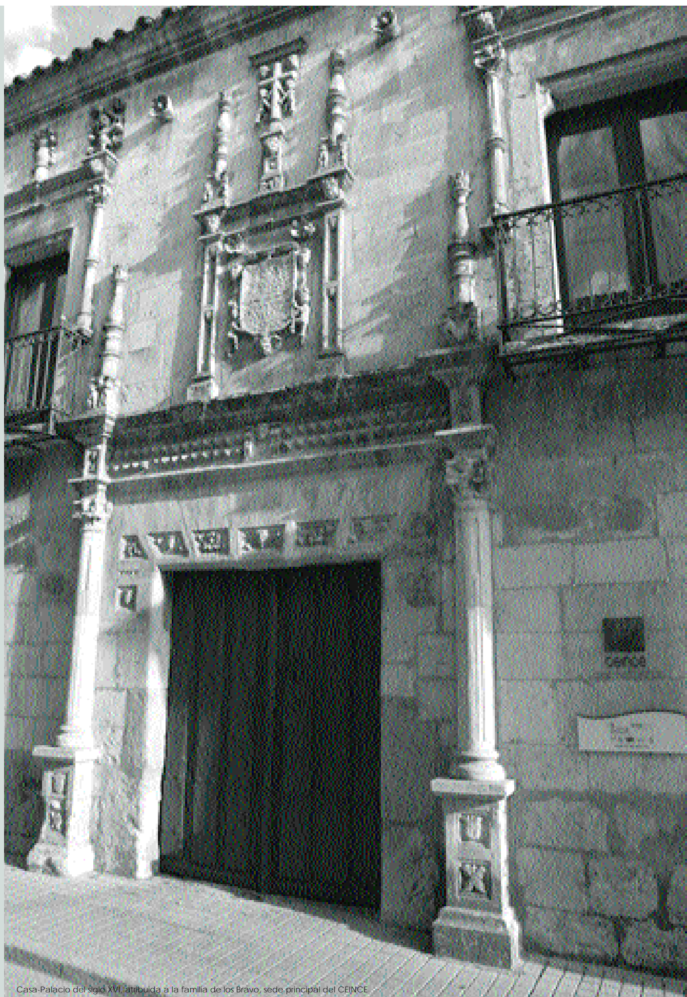
Casa-Palacio del siglo XVI, atribuida a la familia de los Bravo, sede principal del CEINCE

CEINCE C/ Real 35. 42360 Berlanga de Duero. Soria Tel.Fax. 34 975 343 123 info@ceince.eu