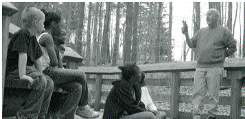
El reto de la diversidad y el multiculturalismo