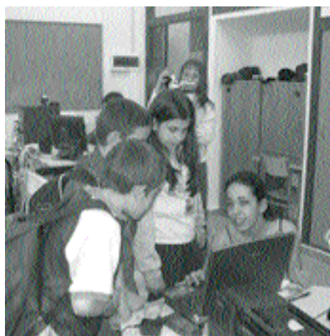
Las cambiantes relaciones de género en una democracia avanzada