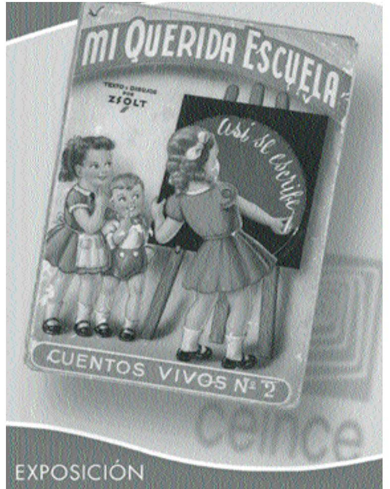
Cartel de la Exposición "Mi Querida Escuela"

A descifrar esta gramática común, sus contenidos y las retóricas que aún sobreviven en parte en nuestras instituciones, y en nuestros hábitos, y a estudiar las interacciones de esta cultura con las innovaciones y los desafíos de la nueva educación, que es a fin de cuentas la que debe importarnos, se orientan la lógica y el discurso que subyacen en el diseño de la exposición "Mi Querida Escuela" que el CEINCE ofrece a sus visitantes como primera muestra del patrimonio hasta ahora recuperado.